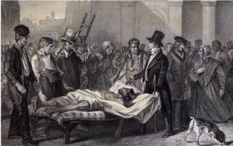
Un cadavre dans un cercueil au cours de la course et l'effroi de la peste. Illustration parlante de la terreur qui inspirait le choléra à Paris en 1832. © J. L. Leveau

Une PANDEMIE (du grec pan = tout et demos = peuple) est une épidémie qui s'étend à la quasi-totalité d'une population d'un continent ou de plusieurs continents, voire dans certains cas de la planète.