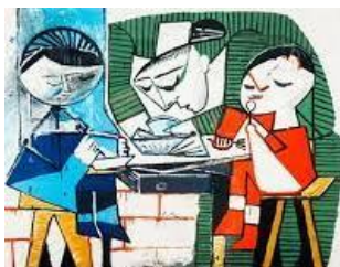
Le repas des enfants - Pablo Picasso 1953