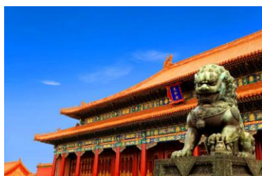
La Cité interdite - Pékin