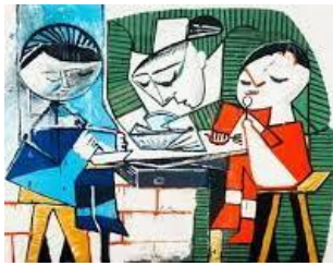
Le repas des enfants - Pablo Picasso 1953