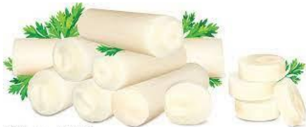
Hearts of Palm whole hearts of palm and medallions